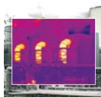
Résolution de 180 x 180 pixels