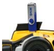
Copie vers USB