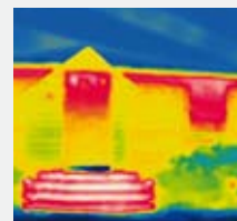
Bâtiment : déperdition énergétique