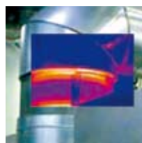
Fusion (PiP redimensionnable)