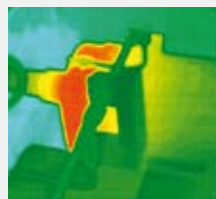
Moteur : problème de roulement